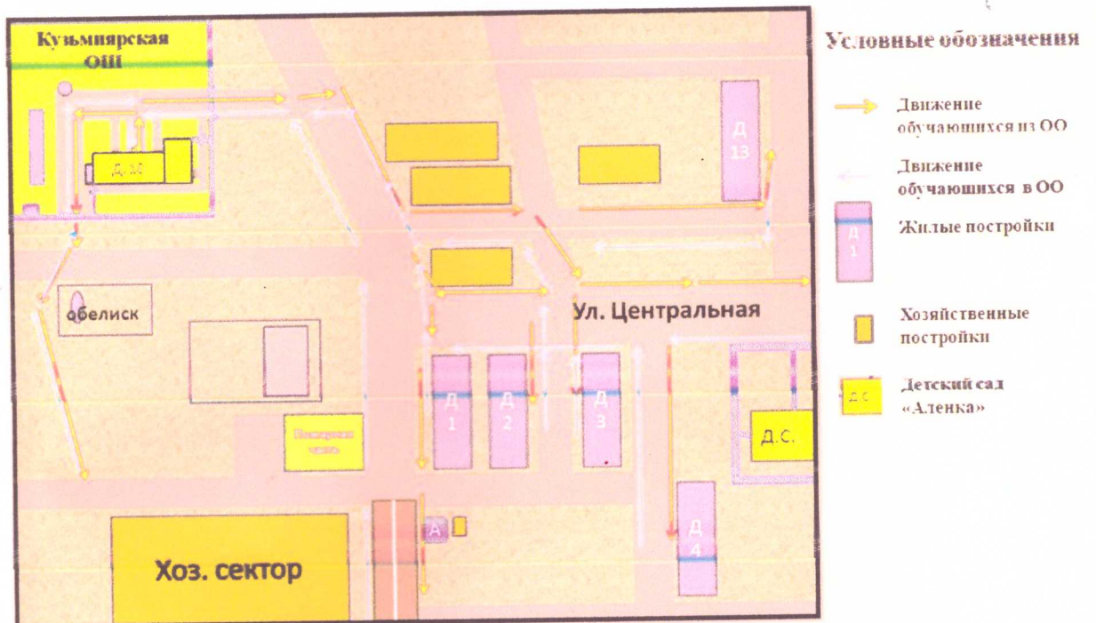
Схема движения обучающихся «Дом – школа - дом»